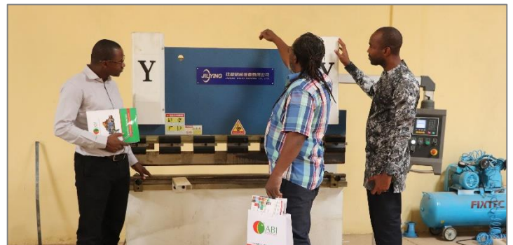
Echanges sur l'état de mise en œuvre du projet de montage et d'assemblage d'équipements et matériels agricoles dans la commune de Loumbila, porté par le Bureau d'Etudes en Energie, Agroalimentaire et Construction Métallique (BEAM).