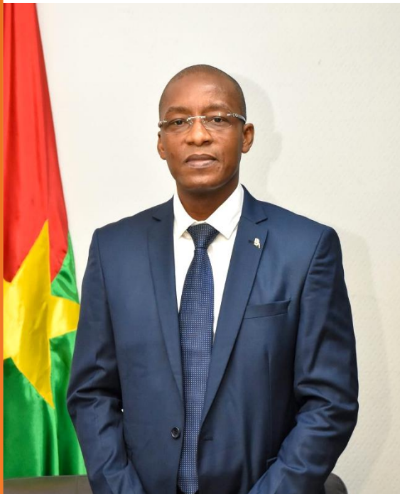
Monsieur Serge Gnaniodem PODA Ministre de l'Industrie, du Commerce, de l'Artisanat