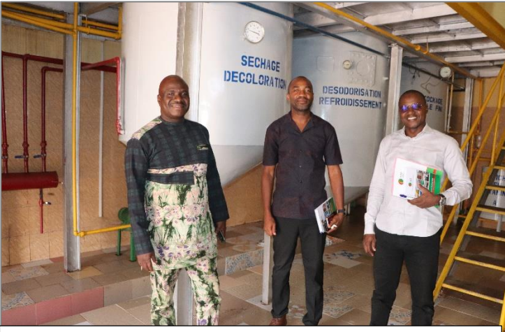
Rencontre d'échanges avec la société SASSOUEYA INDUSTRIE intervenant dans la production d'huile alimentaire et de tourteaux pour bétail à base de graine de coton dans la commune de Bobo-Dioulasso