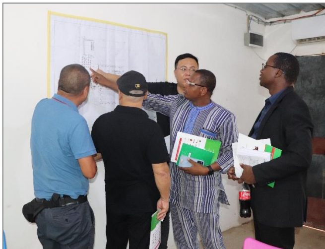
Echanges sur l'état de mise en œuvre effectif du projet de d'implantation de l'unité de production de ciment de la société Industrielle Sino Burkina Ciments SA à Ziniaré.