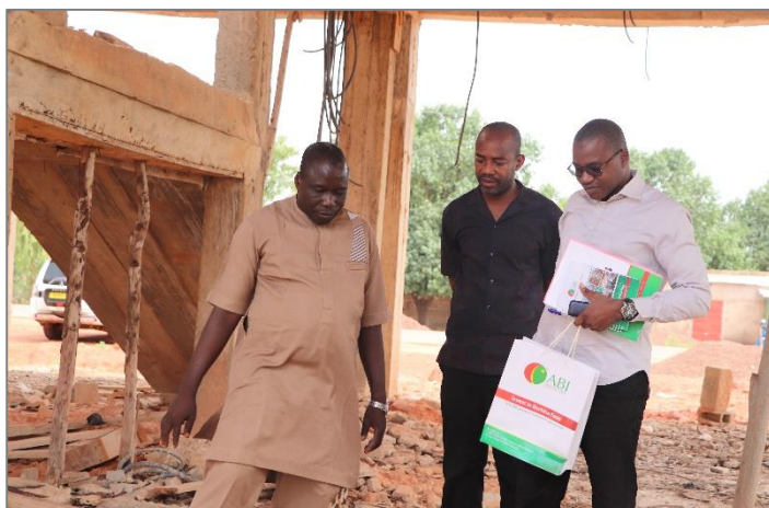
Echange avec le promoteur de la Chaîne de Boulangerie-pâtisserie Zeina sur le site du projet à Kiri dans la commune de Bobo-Dioulasso