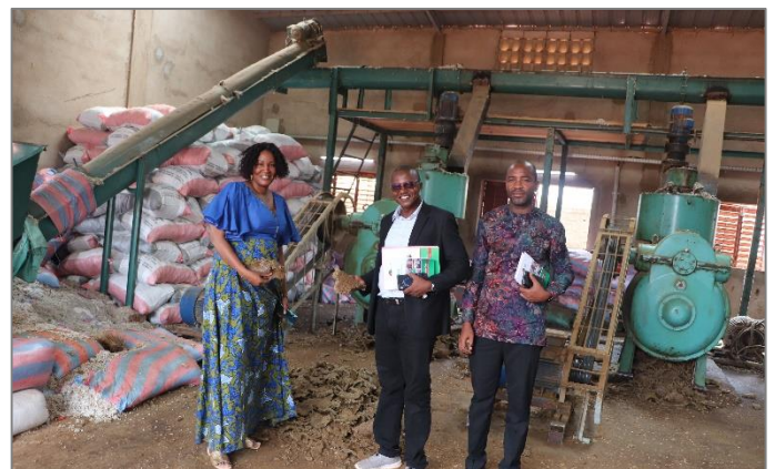
Suivi de l'opérationnalisation du projet de la société « Huilerie NIDOR » relatif à une extension d'activités de production d'huile raffinée et de tourteaux dans la zone industrielle du secteur n°23 de la commune de Bobo-Dioulasso