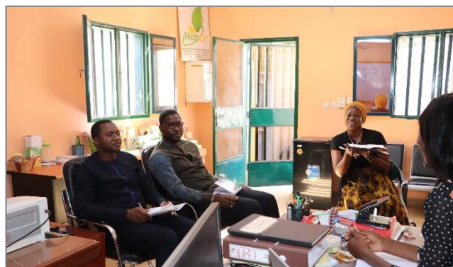
Rencontre d'échanges avec la Société NAT'OR Sarl sur l'état de mise en œuvre du projet de transformation des produits Locaux.