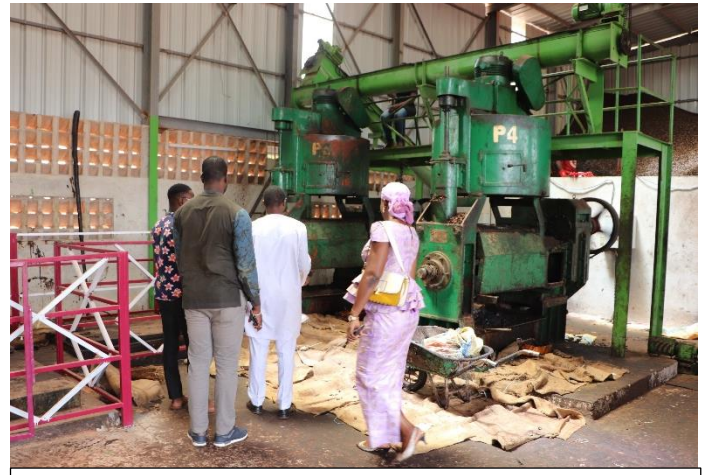
Suivi terrain de la mise en œuvre du projet de transformation des coques d'anacarde en tourteau de coque et de cashew nut shell liquid porté par la société Rejoice Sarl dans la zone industrielle du secteur n°23 de Bobo-Dioulasso.