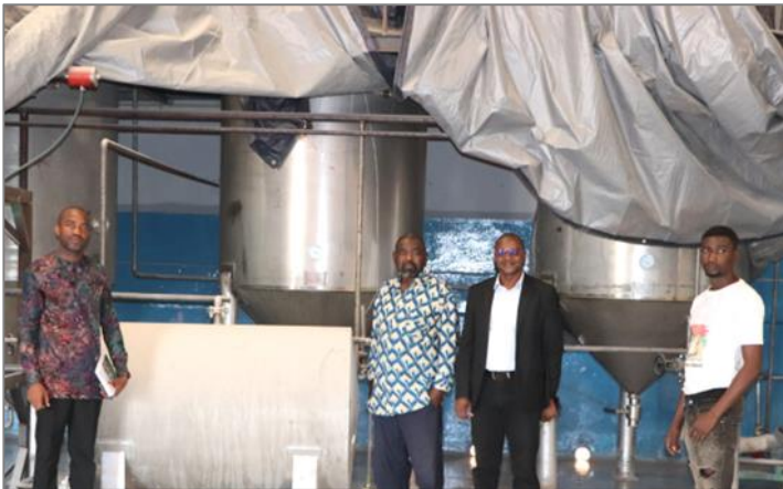
Société Général du Commerce et de l'Industrie du Faso (GECOMIF SA) intervenant dans la production d'huiles alimentaires et d'aliment de bétail à base de soja